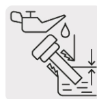
Sensor de nivel bajo aceite